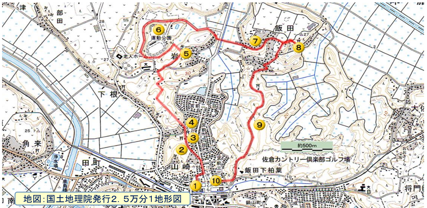
地図: 国土地理院発行2.5万分1地形図

天候があやしい時は、当日6時半頃ホームページでお知らせします。(荒天の場合は中止します)